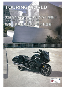
Vol.103 (Winter) 表紙